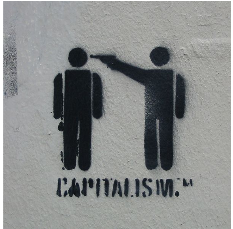
A Stencil graffiti in Lübeck .

Pero en esta sociedad falsa y superficial nunca se solucionan los problemas de raíz, sólo se usan parches.