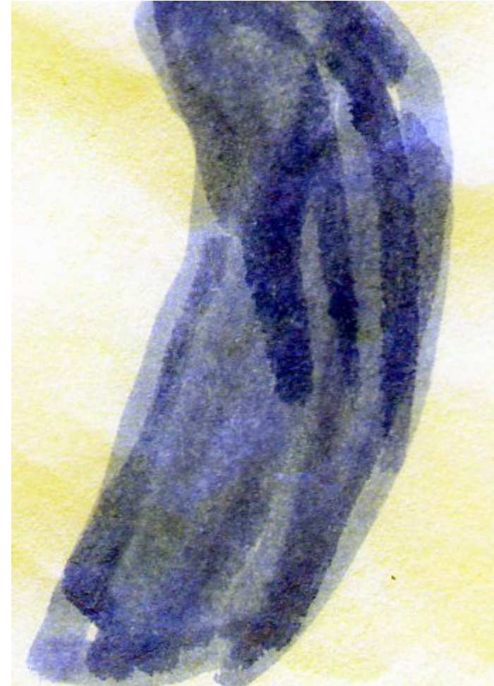
Pintura de Irene

"Alma, región luciente prado de bien andanza, que ni al hielo ni con el rayo ardiente falleces, fértil suelo productor eterno de consuelo"