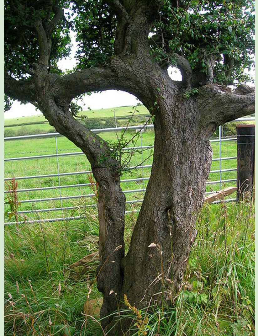
Imagen: Rosser1954 Roger Griffith

Desde este espacio plural, amable y libre, que es de La Maja Endoscópica y a la Maja volverá, desearle mucha felicidad y mucho amor en el día de su boda. Besicos múltiples.